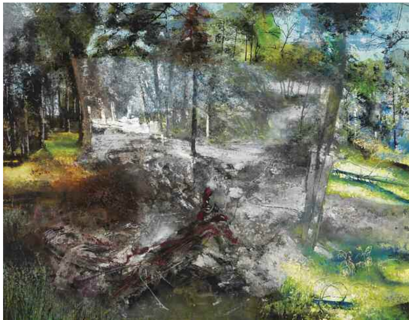
Manuel Domingo Castellanos (Madrid, 1956) El bosque gris 114 x 146 cm Acrílico y anilinas sobre lienzo