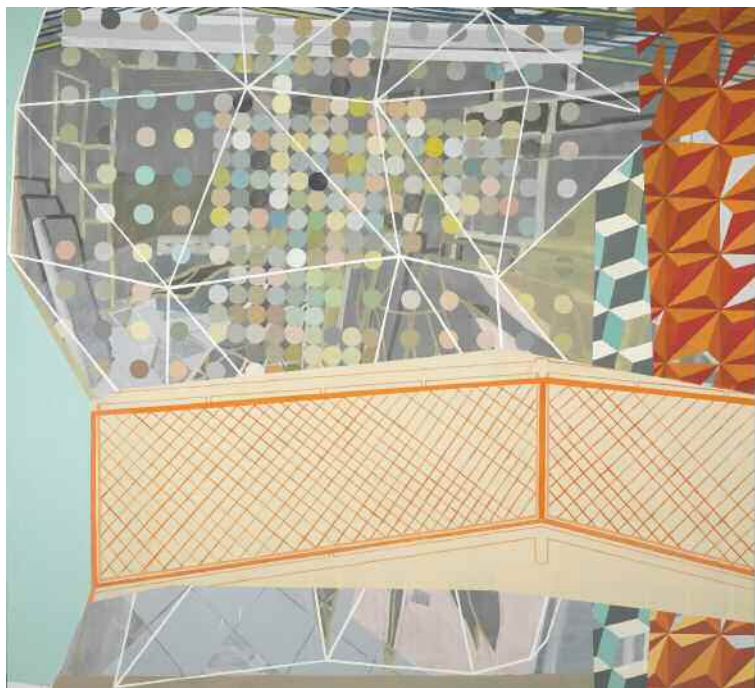
Cristina del Campo Vía (Cantabria, 1981) Staten Island Ferry 180 x 195 cm Óleo y esmalte sobre tela