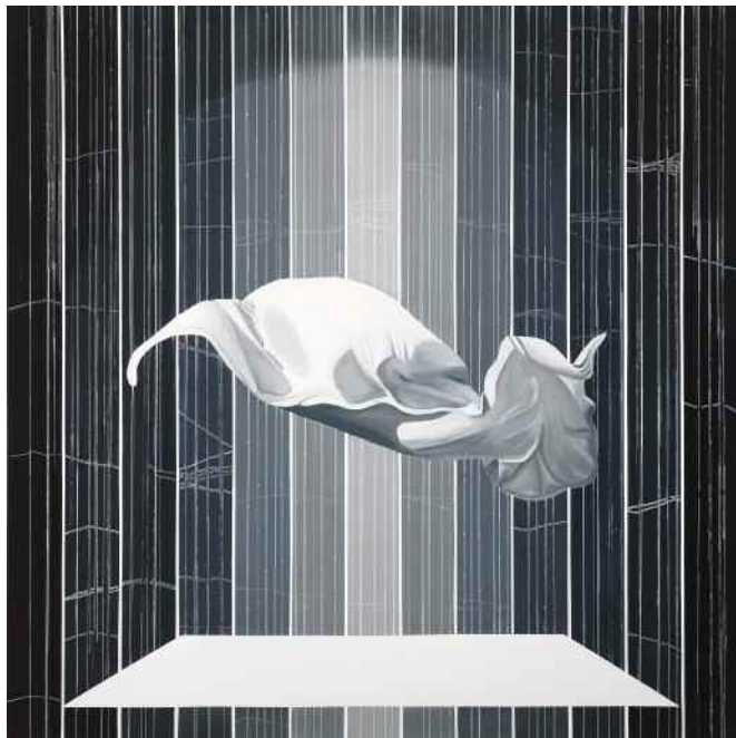
Julia Llerena (Sevilla, 1985) Lost Dreams 155 x 155 cm Mixta sobre lienzo