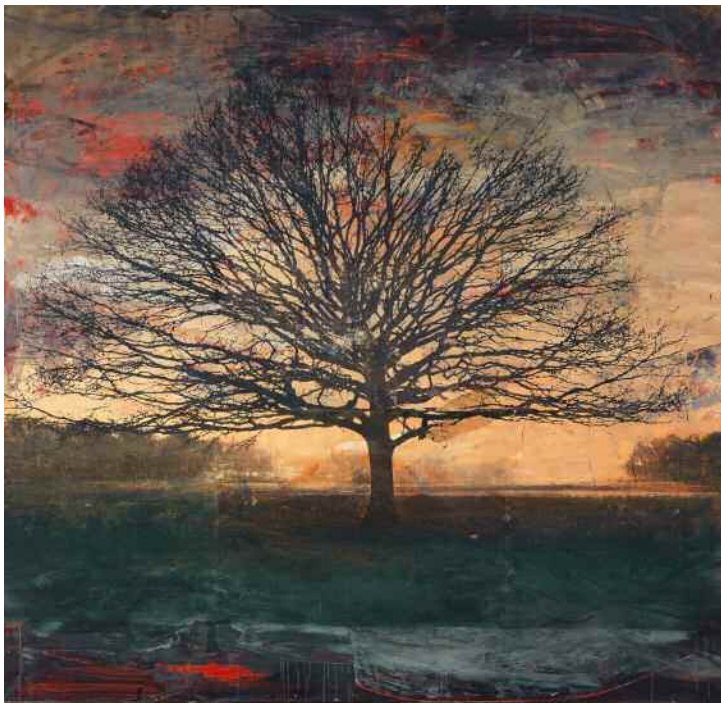
Herme Bellido (Sevilla, 1967) Surrender III 182 x 192 cm Mixta sobre lienzo