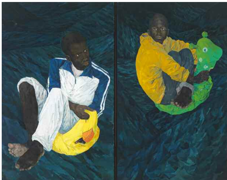
Benito Mateo León (Huelva, 1974) Travesía Infantil 130 x 162 cm Óleo sobre lienzo